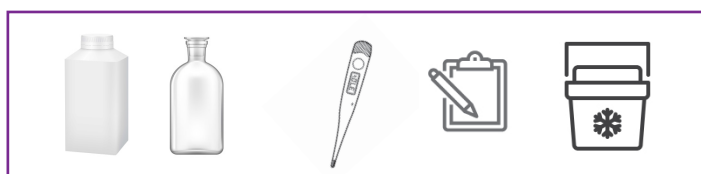
contenitori plastica/ vetro